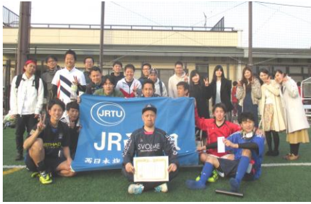
初優勝の草津列車区分会

京都地本は、3月29日(金)に野洲ビックレイクにおいて「第11回フットサル大会」を開催した。各支部から19分会(23チーム)、グループ労組からグランヴィア京都労組(2チーム)の選手・応援団等、300名が参加した。予選リーグは25チームが4ブロックに分け行い、各ブロックの1位・2位が決勝トーナメントに進んだ。 決勝戦は、一進一退の熱戦が繰り広げられ、数少ないチャンスを生かした草津列車区Aが得点を決め、1-0で勝利し、本部大会への切符を勝ち取った。